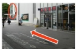
⑤ 通路を抜いたら赤マル方向(サクラス)に向かう