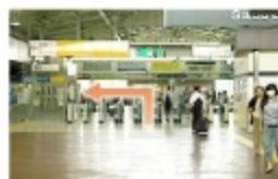
① JR戸塚駅ホームより階段を上って橋上口改札を出る