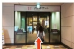
⑧ 正面のフロントゲートよりサクラスに入る