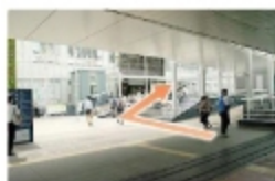
③ 道なりに進み、駅ビル施設トツカーナ3階に入る