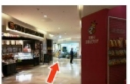
⑨ サクラス1階フロアを道なりに進む