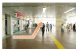
② 改札を出たら左に進み西口方向に向かう