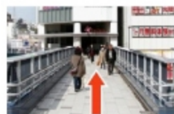
⑥ サクラスデッキを直進して、国道1号線を渡る