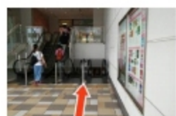
⑦ エスカレータで1階に降りる