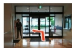
⑪ ノースゲートを出て左に進む ※保険の窓口が目印