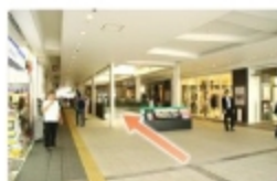
④ トツカーナ3階の中央通路を直進