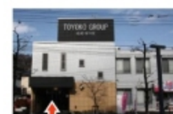
⑫ 目の前に本社が見えませ正面よりインターホンを押してお入り下さい。